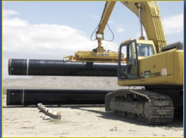
Stapeln von Rohren, fertig zum Absetzen

Die Standard-Saugschale für nur einen bestimmten Rohrdurchmesser ist ideal für den Kunden, dessen Produktion für lange Zeit auf nur einen Rohrdurchmesser ausgerichtet ist.