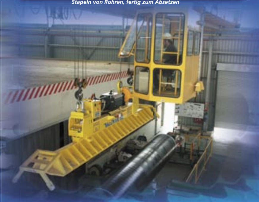
Einsatz im Rohrwerk