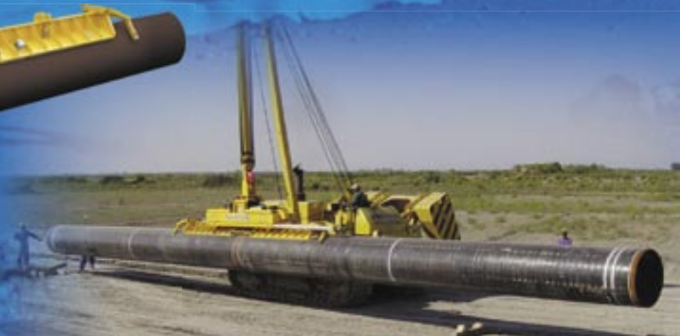
Doppelte Saugschale für aneinander geschweißte Rohre

Um aneinander geschweißte Rohre von bis zu 24 Meter Länge anzuheben, stehen Ihnen doppelte Saugschalen zur Verfügung. Die doppelten Saugschalen unterstützen das Rohr auf einer größeren Länge, wodurch eine übermäßige Belastung des Rohres während des Hebens vermieden wird.