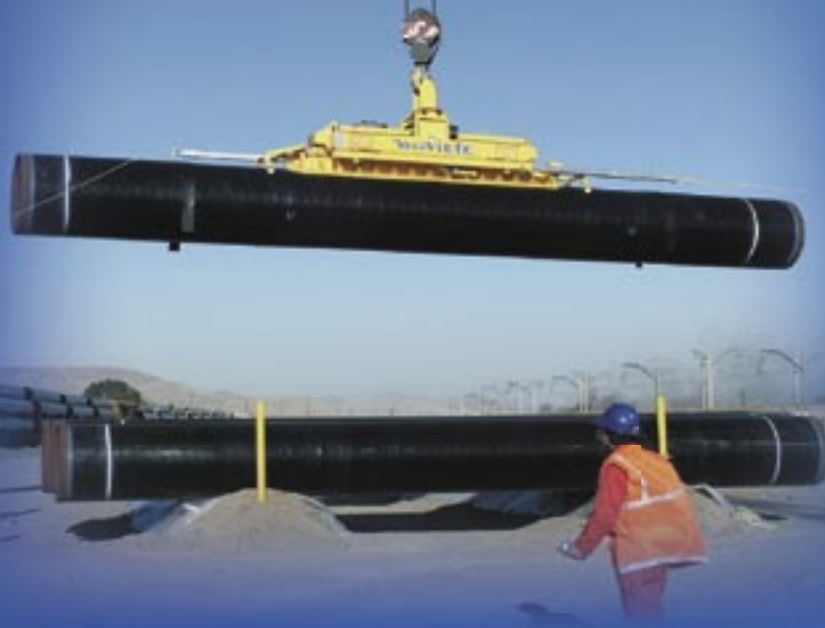
Vacuvietz 12D beim Einsatz mit einem Kran und mit Teleskopstangen

Der Vacuvietz ist ein völlig vom Trägergerät unabhängiges, auf Vakuumbasis arbeitendes Rohrhebeseystem zur Steigerung von Effizienz und Sicherheit im Rohrleitungsbau. Der Vacuvietz kann auf Baustellen und in Rohrfabriken eingesetzt werden. Es sind drei Standardgeräte mit einer Hubkapazität von 12, 16 oder 20 Tonnen lieferbar.