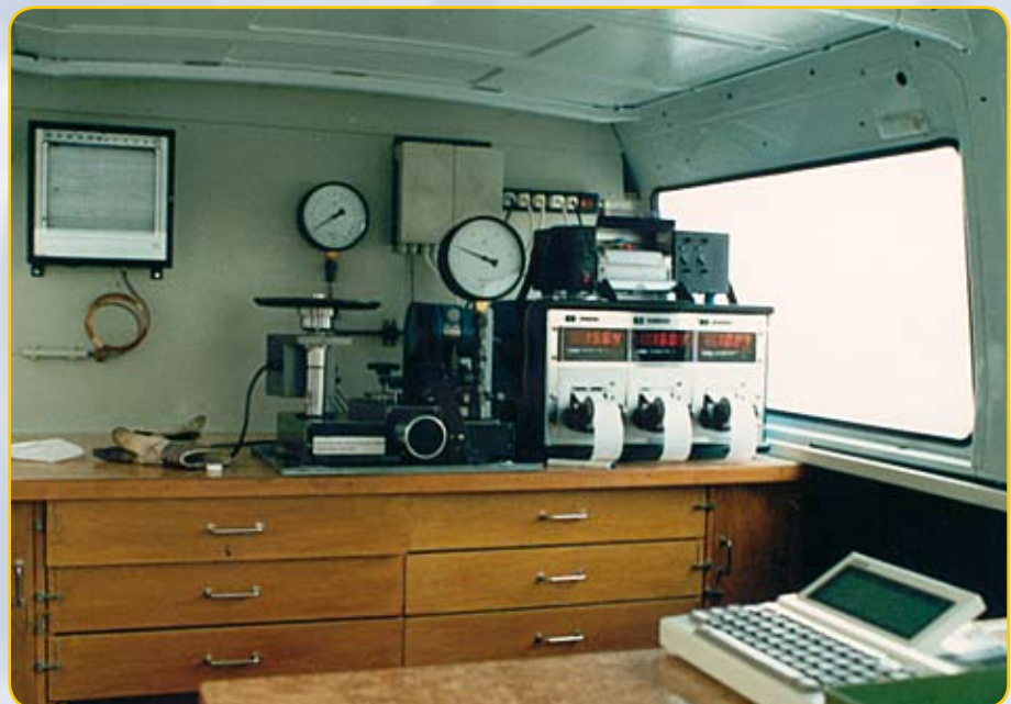
Druckdifferenzmesseinrichtung mit Kolbenmanometer, Schreib- und Computereinheit, eingebaut in einen Messwagen.