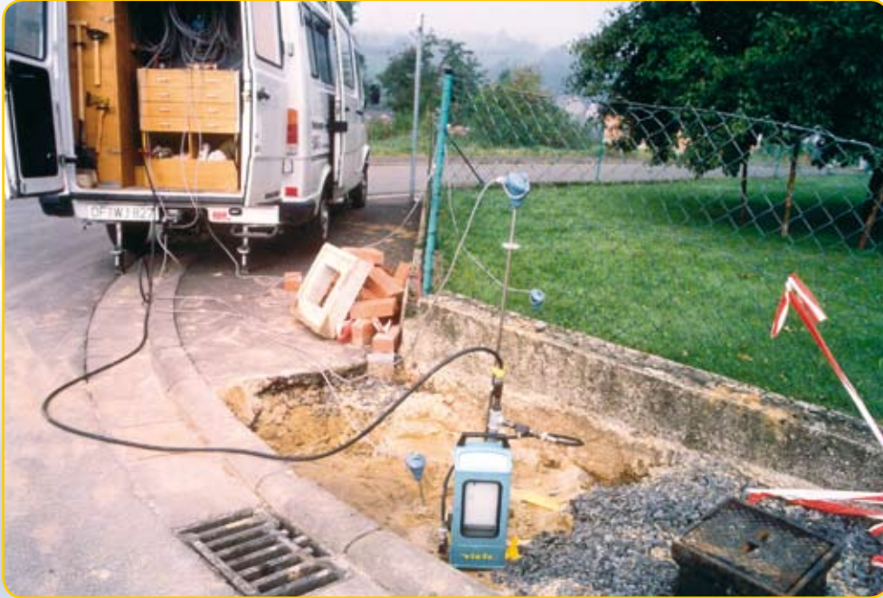
Messwagen im Einsatz