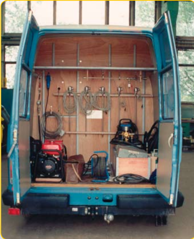
Messwagen ausgestattet mit Rohrleitungsanschlüssen, Temperaturfühlern, Anschlusskabeln und Stromerzeuger.